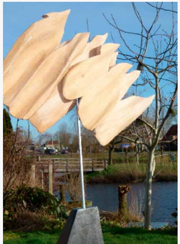
Cees Notenboom liet een werk zien in lindenhout "Vogeltrek"