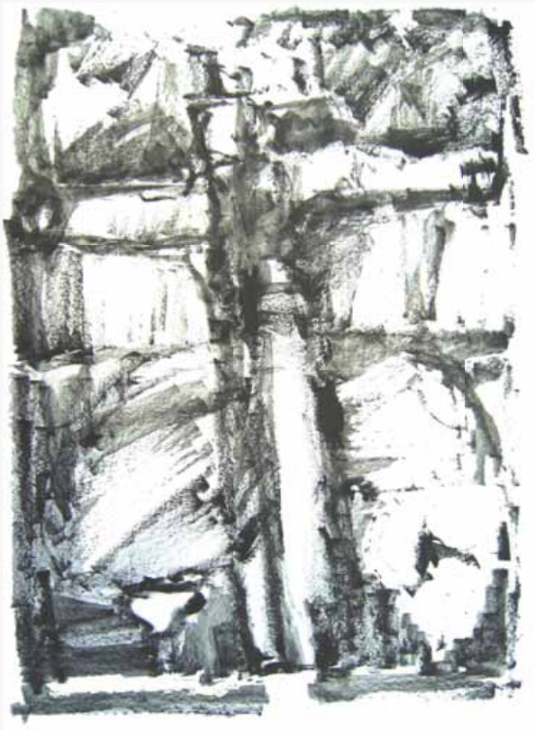
Geert Lammers, tekening potlood (watersolube grafietstift)