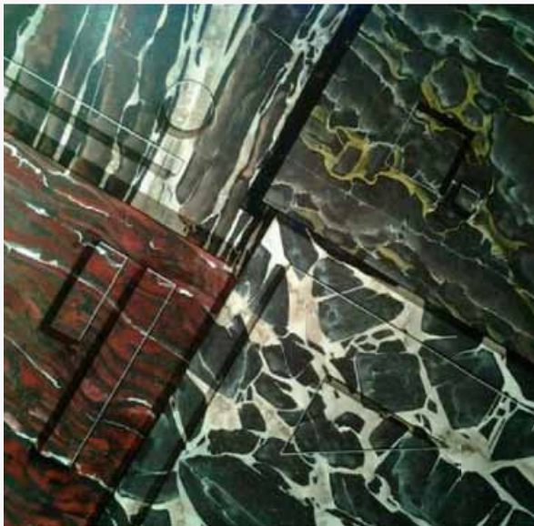
Henk Seppenwoolde, schildelij

We hielden een werkbespreking en Tijs Huisman gaf leiding aan een workshop vormgeven in klei.