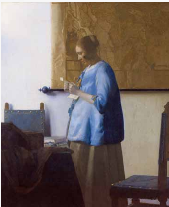
'Het blauwe vrouwtje', Johannes Vermeer