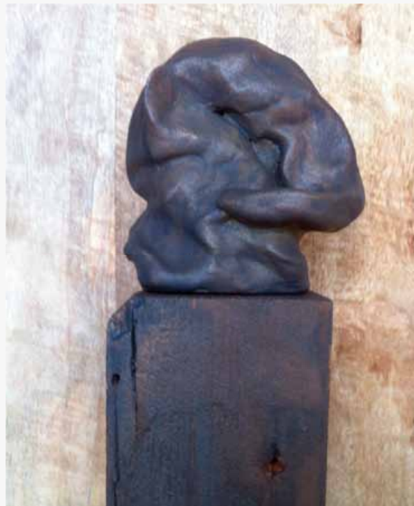
Geert Lammers, Olifantje in zelfhardende klei

Er een gaatje inboren om het vast te kunnen zetten op een sokkeltje. Ook kun je er later wel weer een stukje bij aan maken. Het kan allemaal. Is veel minder kwetsbaar dan keramiek. Krimpt nauwelijks.