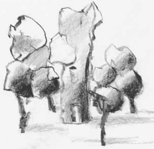
Geert Lammers, tekening grafietstift

Enkele leden vroegen mij naar de mogelijkheden van de watersolube grafietstift. Kijk op onze site www.korfinfo.nl , onder downloads Korfmagazine juni 2012, daar staat een artikeltje over de grafietstift.