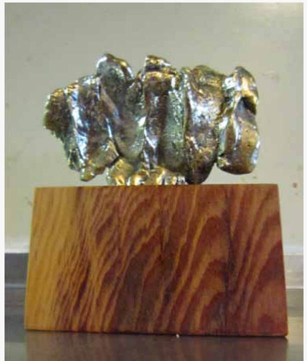
Tijs Huisman, brons