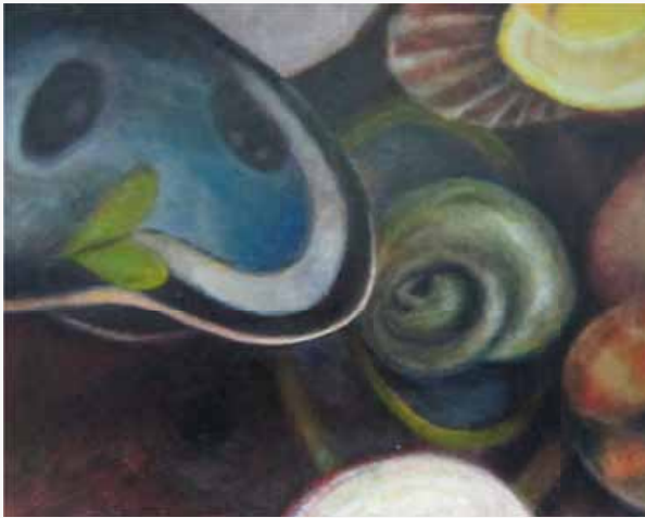
Geertje van den Broek, schilderij met schelpenvormen.