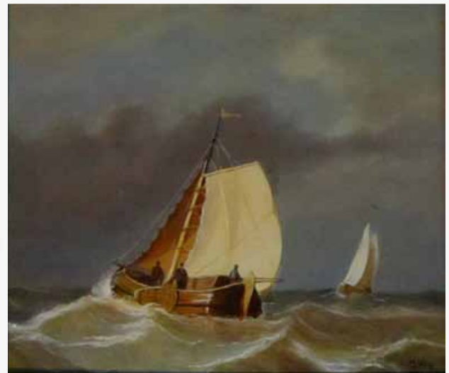
Cees Vos, zeegezicht