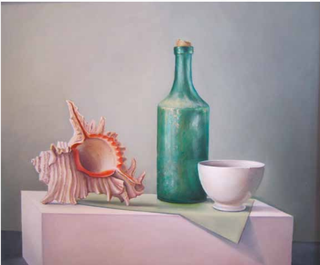
Piet van der Wolf, stillevens, verstillend!