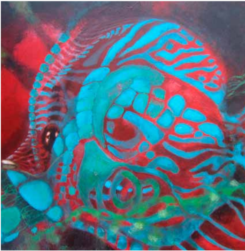
Geertje van den Broek, overpainting, kleurrijk geschilderd.