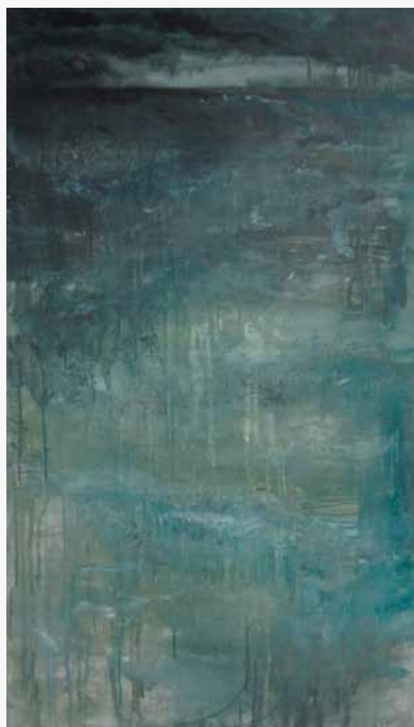
Een schilderij van Wilma, een vrij groot werk