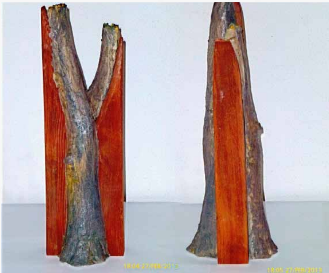
Cees Notenboom, Ceder, krachtig in zijn eenvoud