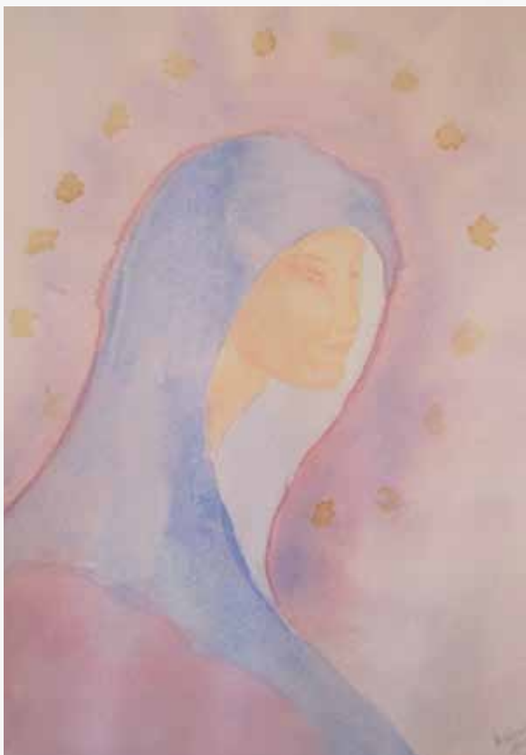
Hilde van Meurs, aquarel met een sacrale uitstraling.