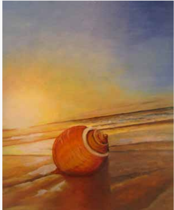
Riet Buis, schelp op strand met een eigzinnige compositie