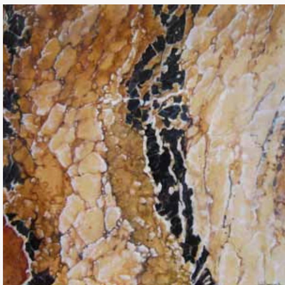
Henk Seppenwoolde, schilderij 100x100 cm, olieverf, uitgevoerd in marmertechniek.

Foto boven: Wilma, zie ook www.korfinfo.nl (nieuwsbrief oktober) voor een interview met Wilma.