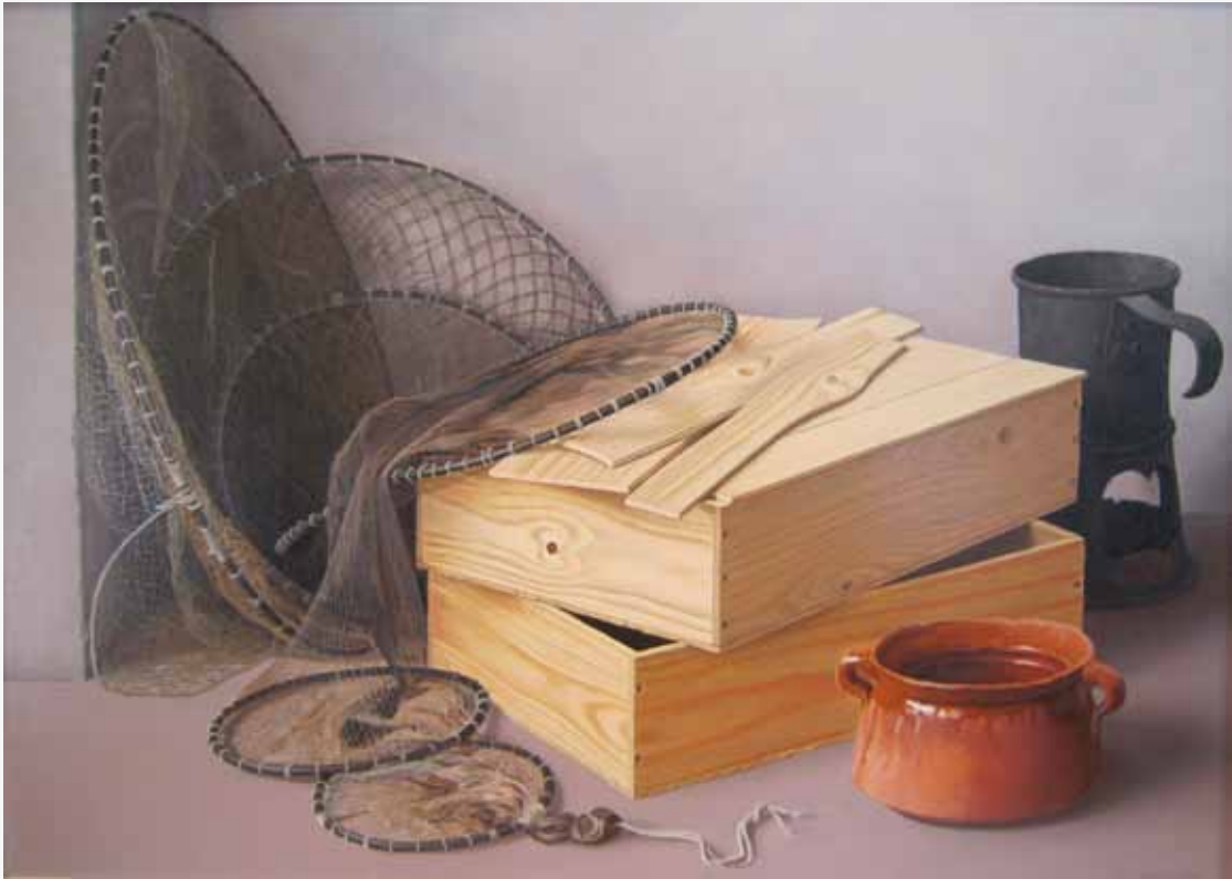
Jan van den Berge, stilleven in olieverf. Boeiend werk met een fraaie stofuitdrukking. Rijkdom!