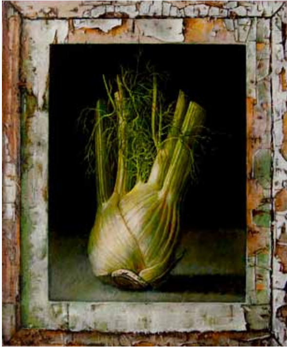
Piet den Hertog liet enkele fraaie stillevens zien.