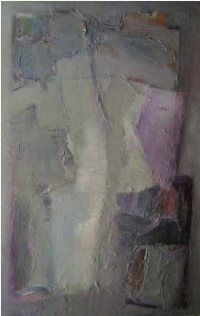
Geert Lammers, abstract werk, acryl op doek 75x115 cm