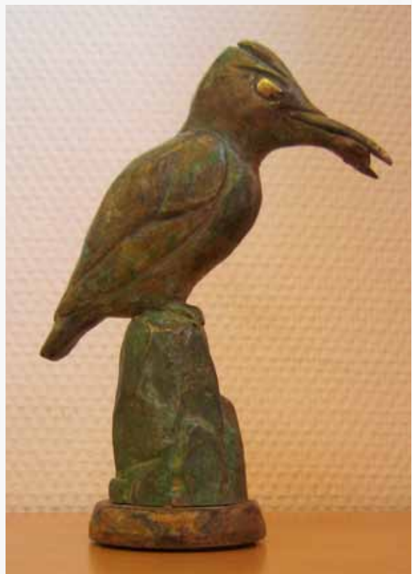
Piet van der Wolf, brons met een mooi patine