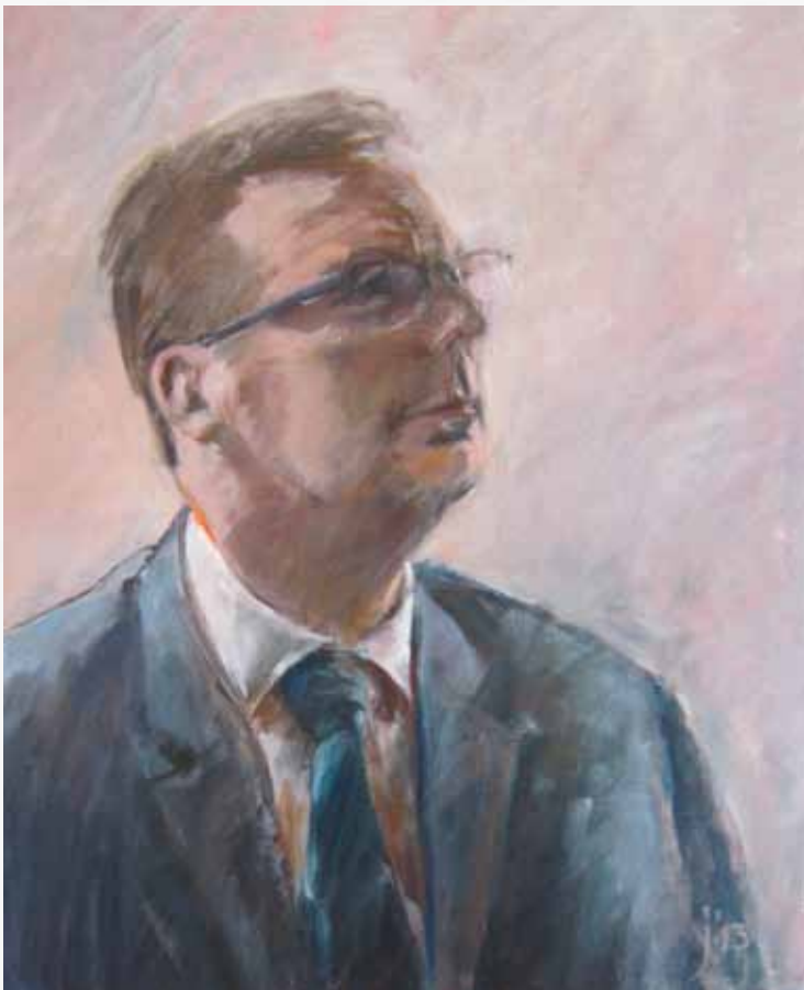
Een mooi portret door Jan den Ouden.