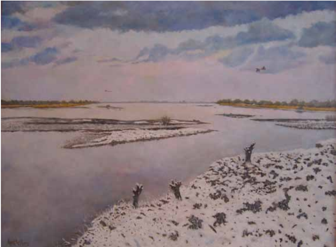
Een winterlandschap van Evert Kuyt in een mooi totaalbeeld