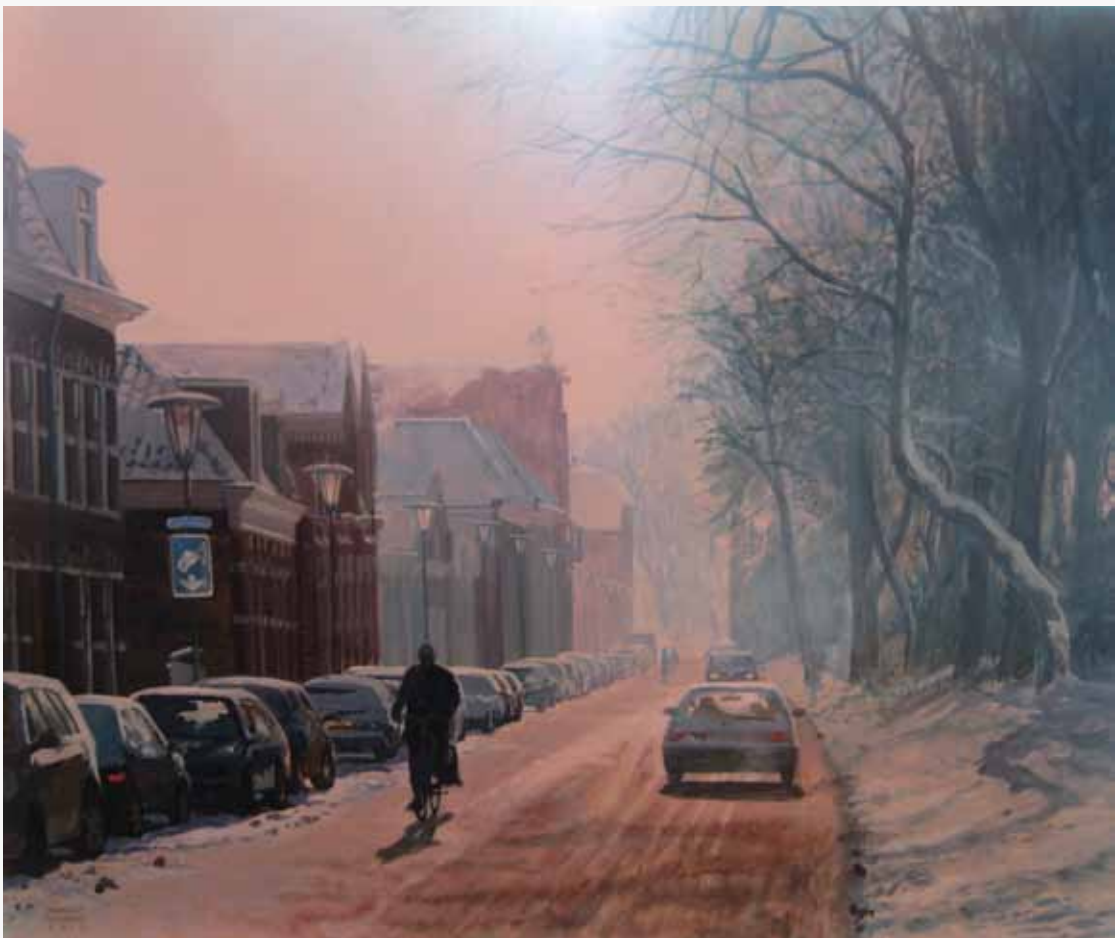
Markus Gouman, stadsgezicht Kampen. Sfeervol met een mooi atmosferisch perspectief.