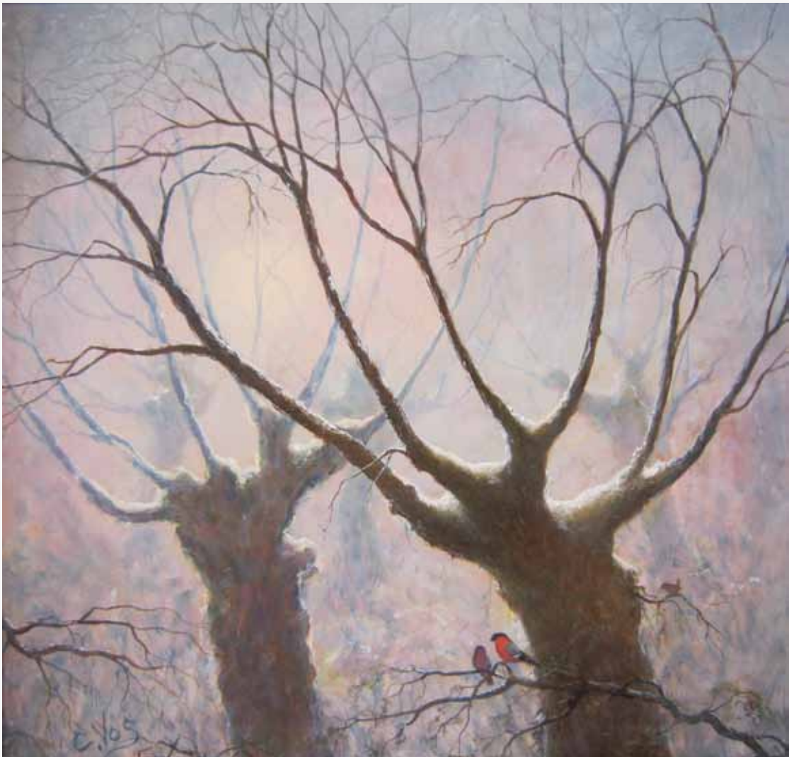
Cees Vos, wintertafereel met goudvinken en winterkoninkje, met intentie geschilderd!