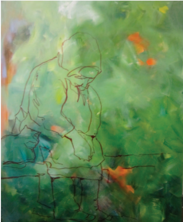
Lizelotte Geurtzema , een fraai werk. Is het af of niet af?