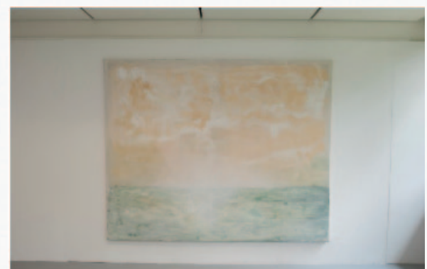
Zonder titel, 198x249 cm, acryl, spuitlak en zand op doek.

Ik zoek naar een combinatie van zachte tinten met diepere, donkere, meer intense kleuren. Sfeer en aardkleuren, om de diepste aard van het landschap naar boven te brengen, daar waar het begin is: de horizon.