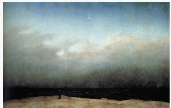
C.D. Friedrich, Monnik aan zee.

daarmee een afwijkende, vreemde noot, maar dat vind ik zo mooi. Die leegheid in het landschap, juist die verontrustende afwezigheid van de altijd verwachte schepen in die tijd. Ik wil – hoewel ik mij klein voel naast Friedrich – hetzelfde doen; die verwachte dingen in het landschap laat ik weg, zodat alleen de horizon overblijft en de twee werelden die daardoor ontstaan. Ook vind ik het impressionisme en de Haagse School erg aansprekend. Werken zoals dat van James McNeill Whistler, prachtig! Meer recente kunstenaars zoals Per Kirkeby, Cy Twombly, Rothko en Anselm Kiefer blijven ook favorieten. Het werk van Twombly vind ik zo spannend omdat er zo'n grote soort spontaniteit in zit. (zie werk hieronder, vind ik erg mooi!)