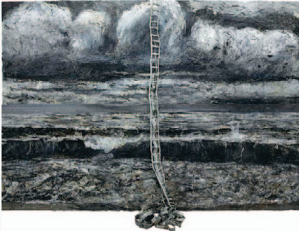
Anselm Kiefer, Am Anfang IIn the Beginning , 2008 - Oil, emulsion & lead on canvas and photopaper, 380 x 560 cm.

enorm beladen en 'zwaar', dat aspect van zijn werk is voor mij minder als voorbeeld. Het gaat vooral om de materiaalverwerking.