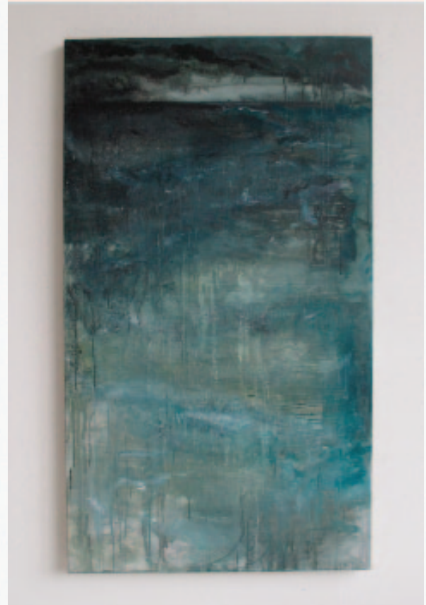
Zonder titel, 140x80 cm, acryl op doek.

Tijdens het schilderen 'regeert het toeval': ik laat me leiden door wat er op spontane wijze ontstaat, door met een kleiner doek met verf over het grote doek te schrappen, door de uitlopende dunne verf of verwerking van stof en zand in het schilderij. Ik werk dan laag voor laag naar voren. Elke laag van verf, druppels of zand en stof is belangrijk en zorgt voor diepte in het schilderij.