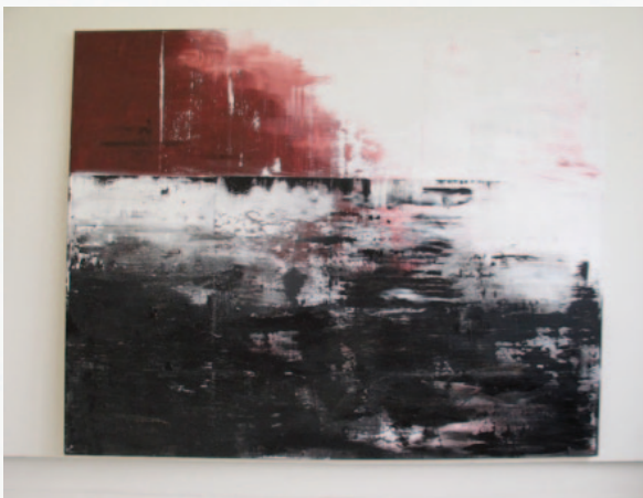
Meer 198 x 249, acryl met stof, draad en zand op doek.

“Je moet het echt in het echt zien, ook omdat het materiaal en de grootte zo belangrijk is!”