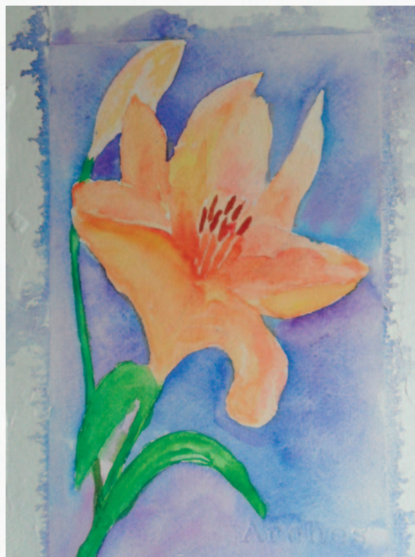
Hilde van Meurs , een bloem met mooie rafelige randen in de achtergrond.