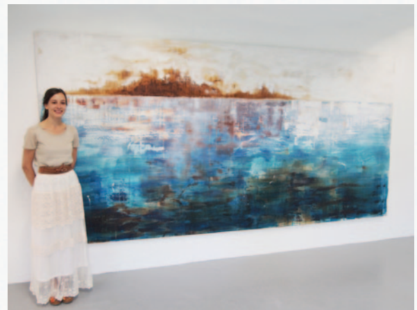
Genese, 380 x 190 cm, acryl met zand en spuitlak op doek.

Toch blijkt ook heel erg bij mijn werk: Je moet het echt in het echt zien, ook omdat het materiaal en de grootte zo belangrijk zijn!