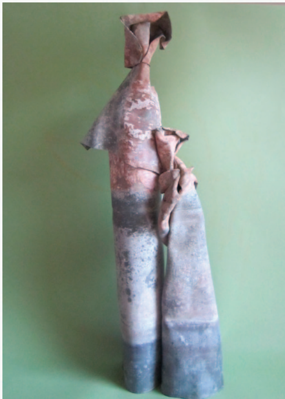
Geert Lammers Moeder en kind, beeldengroep in lood.

Geert Lammers liet twee beelden zien Moeder en kind en enkele werken op A4-formaat en 1 schilderij.