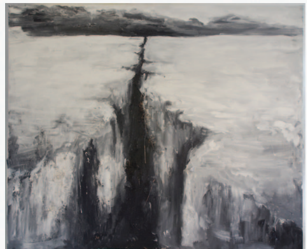
Kloof no 2. 101 x 121 cm. Acryl en gemengd materiaal op doek.

Ook het maken van beeldend werk heeft voor mij alles te maken met waarom kunst mij boeit. Het bezig zijn met de verf, de verftoets, verfbehandeling, met het tastbare materiaal, het experiment met het materiaal.